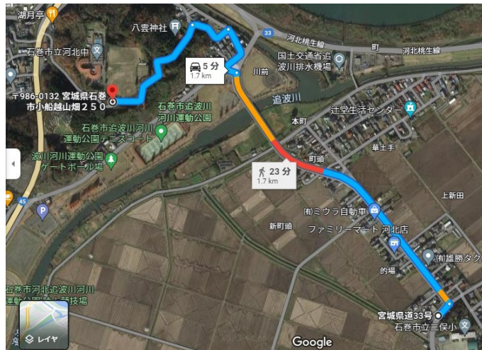
ルート1 (1.7 km) 最短ルート 途中から狭い山道 土砂災害特別警戒区域を通る

それぞれ長所短所があるが、ルート4を基本とし、通行不能の場合は他のルート選択する。下記4ルート以外に川の上前を経由することがあり得る。その場合土砂災害特別警戒区域近くであることに留意する。 ※危険が迫る前の早めの避難、あるいは早めの営業中止を決断することが大前提。