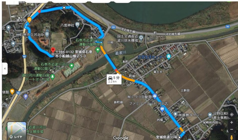
ルート3 (2.2 km) 2番目に短いルート 道幅は狭い 土砂災害特別警戒区域近くを通る