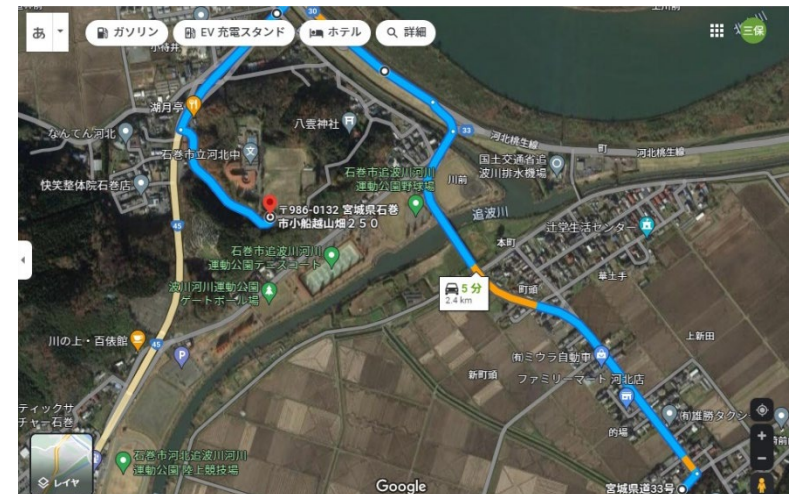
ルート4 (2.4 km) 大きな通りルート 比較的的道路は安全が 渋滞の可能性あり